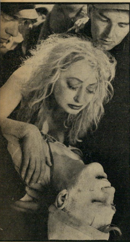
"הלילה העירום" עירומה במים, הזקנה

הצרה היא שלא רק גיבורי סרטו של קלייר מעדיפים את הישן על החדש, אלא גם קלייר עצמו. הקולנוע צעד קדימה ב' שלושים השנים האחרונות, אך קלייר נשאר