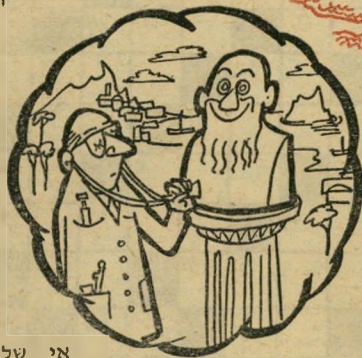
אי של היפוקראטס, אבי הרפואה, אשר ידע כי מקור הבריאות הוא בשמש ובאוויר הצח.