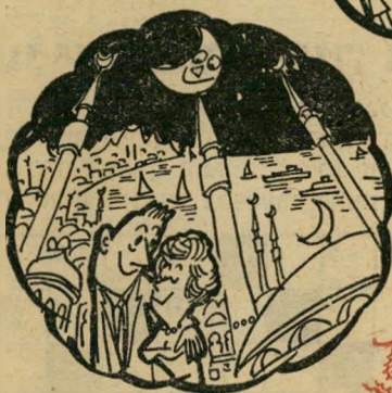
בירת השולטנים על שפת הבוספורוס ונמסגדיה הנפלאים.