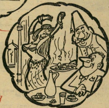
חיי אלף לילה ולילה באיסטנבול: ראקי, רחתי-לוקוס; תופים וזולאיקות.