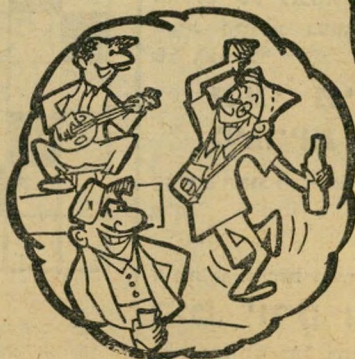
יוון עליזה ורוקדת, לא "רק בימי חול" — גם בפסח.