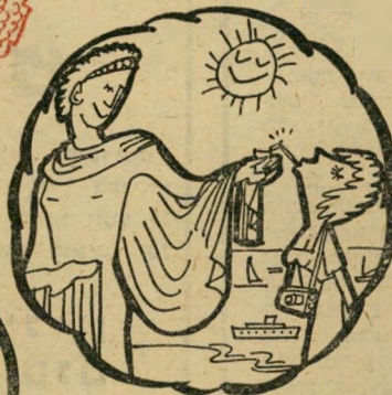
ביקור בעולמם של אלי יוון, באי בו נולד אפולו, אל השמש והשירה.