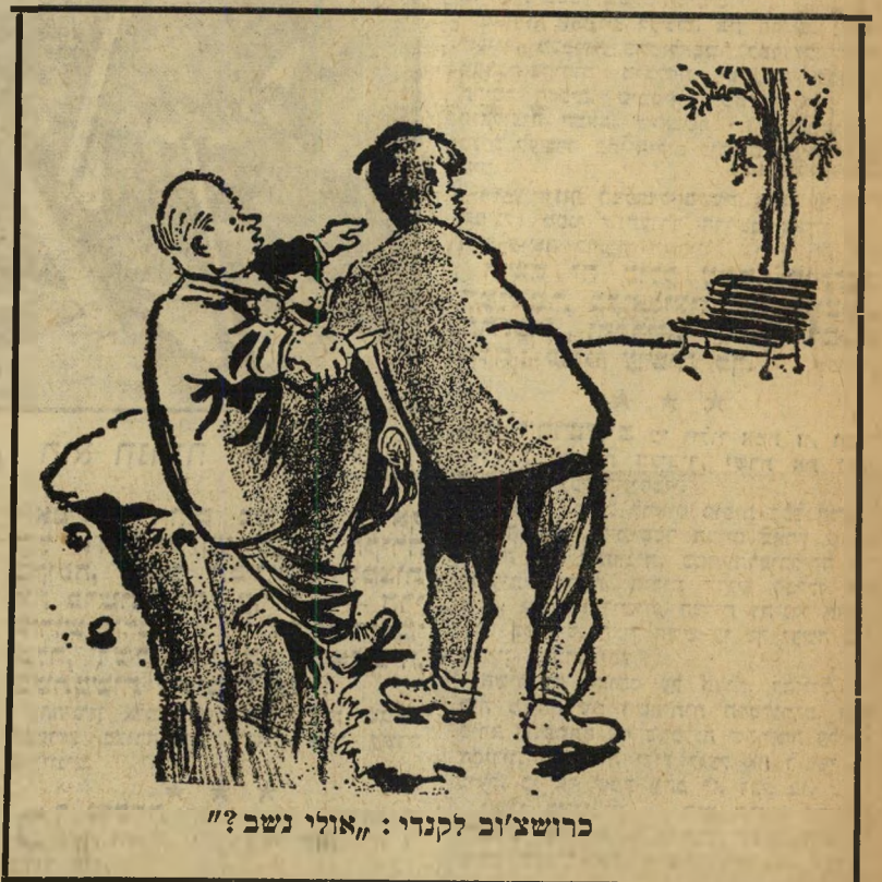
כרושצ'וב לקנדי: "אולי נשב?"

רק לקבל ממנו נדבה בצורת "התקשרות", שתתן לה זכויות ללא חובות. גם הטענה הישראלית, כי ללא התקשרות זו צפויה כליה למדינת ניו-זילנד-היטלר — איבדה את בסיסה. כל עוד בריטניה בחוץ, יכולה גם ישראל להישאר בחוץ מבלי להינזק. הייצוא הישראלי לשש ארצות השוק המשותף בלבד אינו גורם מכריע במשק הישראלי.