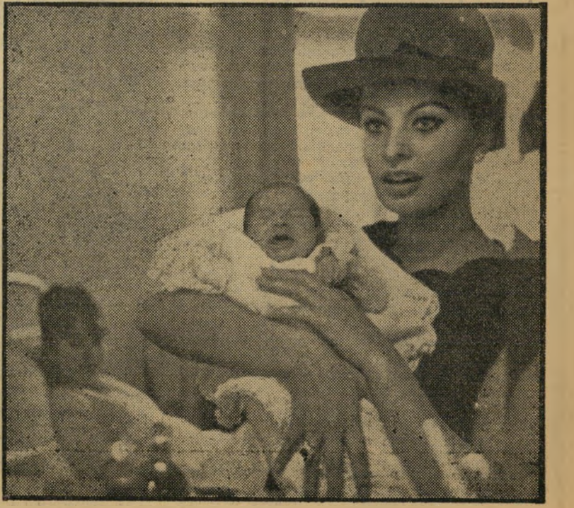
סופיה לורן עם אחותה ונכדו של מוסוליני יותר מדי חזטאת