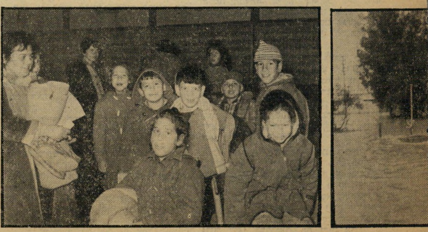
חנת-הדלק מוצפים ילדי כפר-נחמיה בשמיכות מחכים לבני

בסך הכל, לפי הערכה חסיפה, גרמו המים לשני הקיבוצים נזק של מיליון ל"י. לעיר מתם, התבוננו בשמחה במטר הסותף, החק-לאים שבמרכז הארץ. ואילו חקלאי הדרום עקבו בייאוש אחרי שרידי העננים המתפז-רים. עבורם נשארה הבצורת בעיצומה.