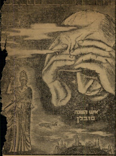
אישה השנה סובלן

הסיכום, עליו מסרו השבוע לממשלה השרים בכור שיטריה, זרח ורפהטיג וישי ראל בריהודה, לא היה שונה במא-מה מן ההצעה ששר-התחבורה הציע לשוא לי דתיים, בראשית המשבר. גם אז הסכימה אליעל להקצות מספר טיסות-חינם בכל שנה לאנשי מחלקת הכשרות של הרבנות, למען יוכלו לדרח על טיב הכשרות במסרי סיפ.