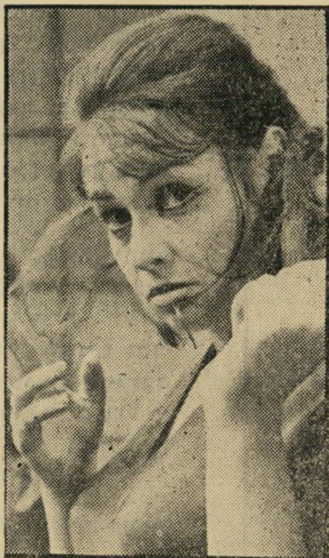
אלמגור ב' האידיוטית"

פאבס לעולם אינו משתמש במכחול. כל ציורי-השמן שלו מצויירים בסכין. על רקע בסיסי, אפור על פי רוב, הוא מורח קחים שחורים, לרוב מצטלבים. לאחר מכן הוא חורט בסכין בתוך הצבע, כך ששריטות הסכין יוצרות מעין קחים בהירים בתוך השחור. שאיפתו: למצוא את כל צבעי ה' טבע בשחור ואפור. רק לעיתים רחוקות הוא משתמש בצבעים ממש, צהוב או ירוק. התוצאה: ציורים המפתיעים בשלל גחני' הם, המלביחים את הדימויו והספוגים מצבי' רוח. אחדים מהם מזכירים בצורה מורה את אוירתם של ציורים סיניים עתיקים. בשביל פאבס עצמו היתה התערוכה חזיה משחררת. סוף-סוף עלה מן המתחרת.