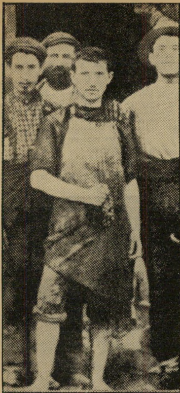
דויד בן-גוריון (במרכז), 1907 לא למדו, לא שכחו

* דבר שגרם לכך כי ספרי המכבים אינם קדושים ליהודים, אלא רק לנוצרים. ועדתי-הכנסייה משנת 1546 העניקה למכביים אי ריב' מעמד של קדושה, בעוד ש- היהדות, בתקופת השלטון הדתי, לא טרחה אף לשמור על הספרים. הפרקים שנכתבו במקורם בעברית (כמו כל מכבים א' האנטי-פרושי) נשתמרו רק הודות לזרים, ובתרגום יווני.