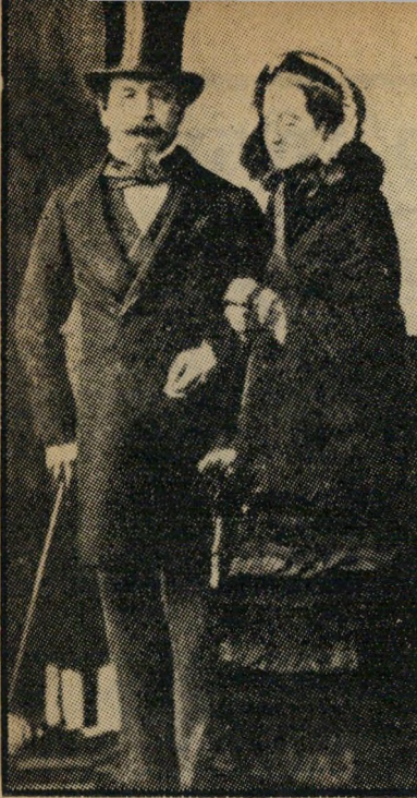
נפוליאון ה-3 מח 1873

נפוליאון ה-3 היה בן אחיו של נפוליאון הגדול. בניגוד לדודו, לא היה גאון. בנעוריו היה חורר אידיאליזם ליבראלי (כאשר הליבראליזם עוד היה רעיון מהפכני), ואיפיו שמהלך.