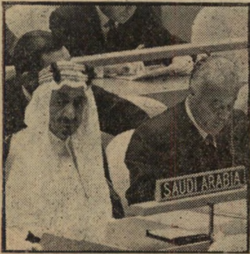
משמין שוקיירי בפעודה

ידידנו בעתונים השונים אף מצאו ש ציטוט זה נהגו כה מעניין וחשוב, עד כי יש צורך להבליטו במסגרות מיוחדות. העיתונאים לא ידעו, כמובן, כי שוקיירי רק חוזר על צצמו. מדי שנה בשנה, בדיי קנות של שעון מקולקל שעמד מלכת, הוא מצטט בנאומו הגדול את המישאל שערך העולם הזה (1024) לפני חמש שנים בין ילדי כיתה א', לבדיקת יחסם לערבים. זהו חלק מן הרפרטואר הקבוע של שוקיירי, שאינו סורח לחדש את מובאיו. כל הדיפלומטים בא"ם יודעים את נאומו