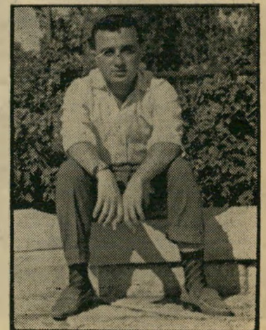
פקיד אומריאן באופק: מקצוע חדש