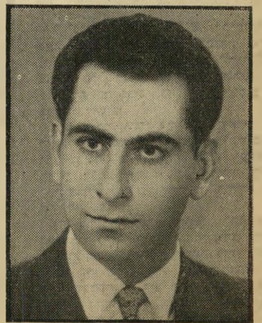
רתך חראד האז עומד להגר

"הג'נרל ניצח את הבגרות!" קרא אחד הארבעה, בורקו את הפיסת הקלפים על השולחן. חבריו צחקו. אך למרות הצחוק, קל היה להבחין במרירות המשתמעת ממנו. כי מזה שנה גמרו ארבעתם את לימודיהם בבית הספר התיכון. שניים מהם עברו את בחינות הבגרות, השניים האחרים עברו את בחינות הג'נרל סרטיפיקט. מאז גמרו את לימודיהם היו מחוסרי עבודה, המוסד היחיד שקלט אותם היה בית הקפה הזה. "אתם יודעים? סוליימאן שלח לי מכתב," אמר אחד מהם פתאום. "מה הוא אומר?" שאלו השלושה, כמעט בקול אחד. "הוא לומד טלביזיה," ענה חכם בקיצור.