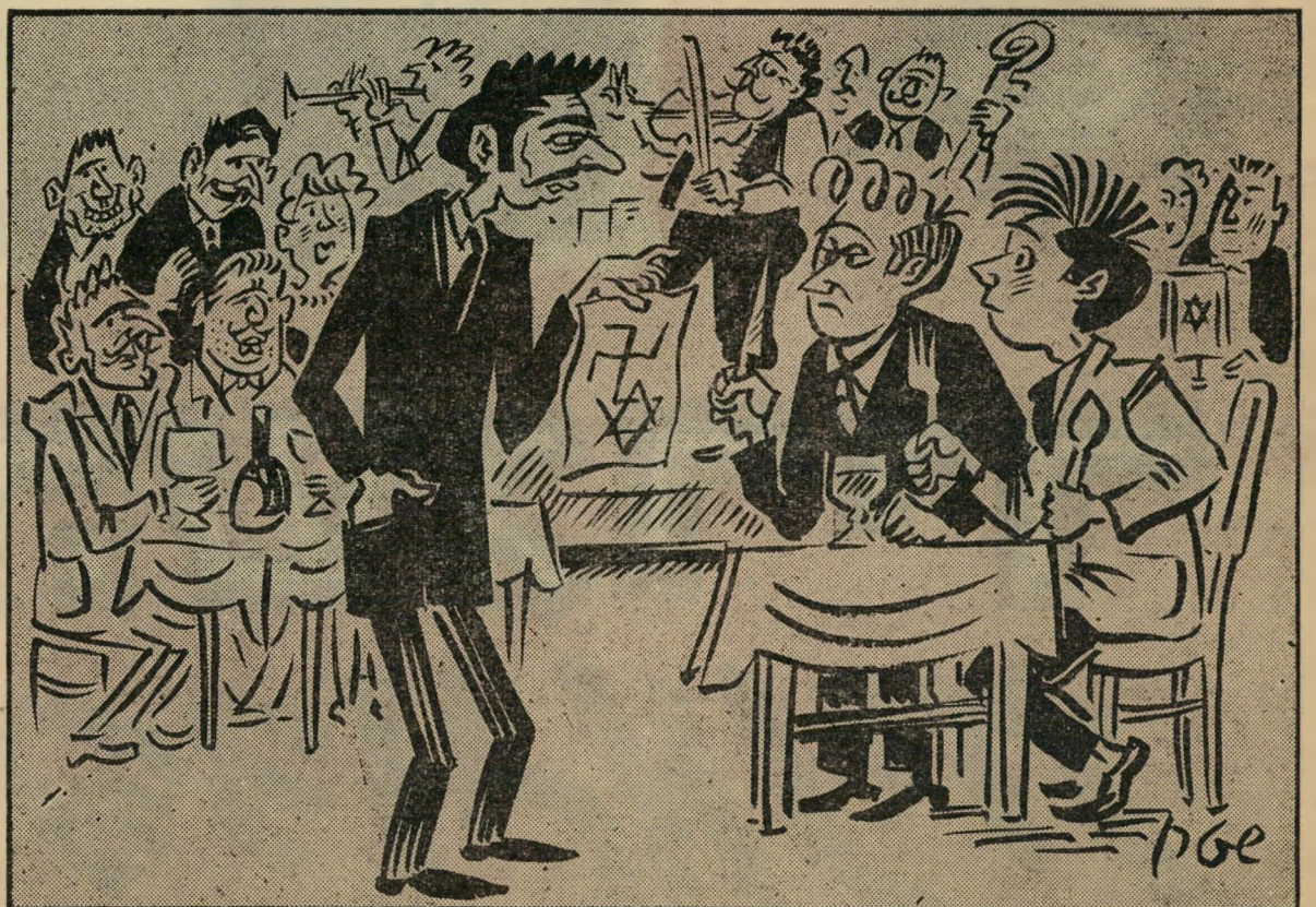
„חברי הצבר יצא עם סכין ביד... גיליתי שנכח באולם ציר ישראל (ימין)...“

אחרי שבועיים בהונגריה התברר לי ש- אינני יכול כבר לעמוד בפילפל ובפאפריקה המקומית. התגעעתי לסלטים ולשישליק ה- מרחחים. ניתקתי סופית את הקשרים עם המולדת ההונגרית, ונסעתי לאיטליה.