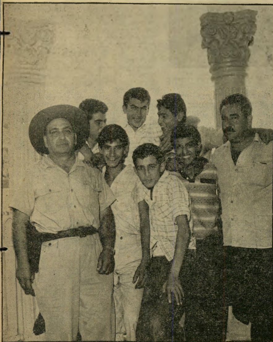
שנעצרו מיד אחרי הקסטרה הראשונה, בלונה פארק של ראשון-לציון. הם בסך-הכל נערים" מתלוננים קרוביהם, „אך הציגו אותם כבניונים מסוכנים“. גילם נע בין 16 ו-17 שנים.

ישנו סוג אחר של ערבים המחפשים עבו' קרומה מול זהות דאומית קבוצה של האישה הערבית נקבע עלידי החברה הערבית לפני עשרות דורות. היא השיפחה-מבשלת-יולדת-מחוננת, שאינה יוצאת כמעט מביתה. בארצות ער' ביות רבות קם הדור הצעיר נגד מוסכ' ערביים של ערבים המחפשים עבו'