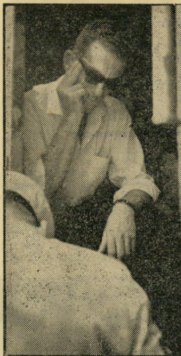
ביברשטיין במכונית המשטרה מחצית שנה בטרנוסטור

קבע השופט זילברג: "הרשעה זו אין לה על מה שתסמוך. היתה כאן עדותה היחידה של המתלוננת והיא לא הסתייעה בשום ראיה אחרת... הטעם שבגללו זקוקה עבירה מינית לעדות מסייעת הוא ברור, מפני שעדותה של המתלוננת היא כמעט בגדר עדות, שאין אתה יכול לה"זימה". מעשי בינו לבינה נעשים בהסתר ובאין רואה. אם יורשה השופט להרשיע על פי עדותה היחידה של המתלוננת, עלול דבר זה לשמש מקור לא אכזב לנקמנות ולסחיטה... אולם לוא גם סברתי אחרת, עדיין הייתי מהסס לאשר את הרשעתו של הנאשם. המתלוננת סתרה בעצמה הרבה מ"דברי עדותה. היחסים בין האב והבת היו מתוחים מדי. המערער ביקש מהמשטרה ש"תיקח דם, כדי להשחתו עם הדם שנמצא על המטפחת, היינו דם נידה לטענת ה"על