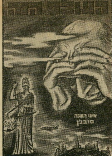
איש השנה סובלן

כורעת לפרת? ב"ב, דבר, ואפילו תרופה רהופה או רגילה, עלינו ללכת עד כפר יסוף לפחות.