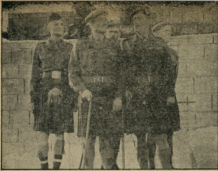
4. צלילי תהילה (בריטניה)