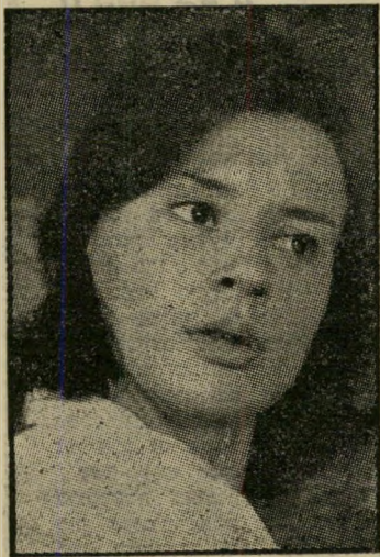
שחקנית השנה הרייט אנדרסן מבעד לזכוכית האפלה

אפשר, אולי, למצוא מאורעות מיוחדים שאיפיינו את תשכ"ב לגבי צופה הקולנוע הישראלי. היתה זו שנה בה הולעט בפולרי סופית החיים הקולנועית של גאון הקולנוע