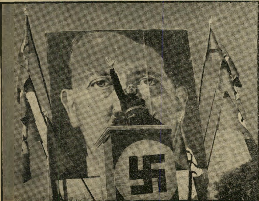
2. קאנדיד (צרפת)