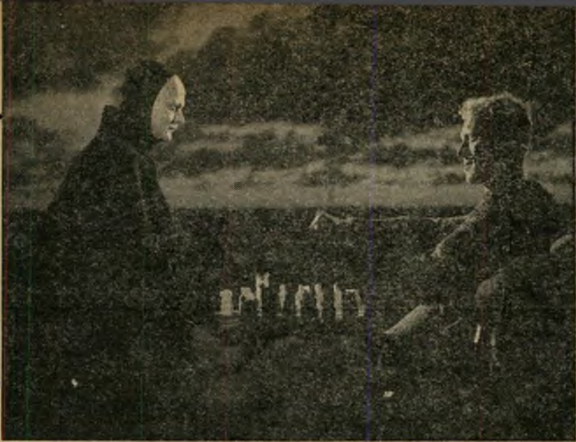
2. החותם השביעי (שבדיה)