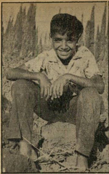
מתאבד דורון חינוך דתי

החלו לעודדו בקריאות. הוא קם ממקומו, החל זורק אבנים לעבר המורה שעמד בח' לון. כהרף עין ירד המורה למטה, גררו חזרה לכיתה במעלה המדרגות. מישהו מהתלמידים רץ לביתו של ראוי בן, הזעיק את אמו. אולם היא לא יכלה להיכנס אל בנה, כי המורה נעל את דלת הכניסה הראשית. היא ניגשה לטלפון, הוי מינה את המשטרה.