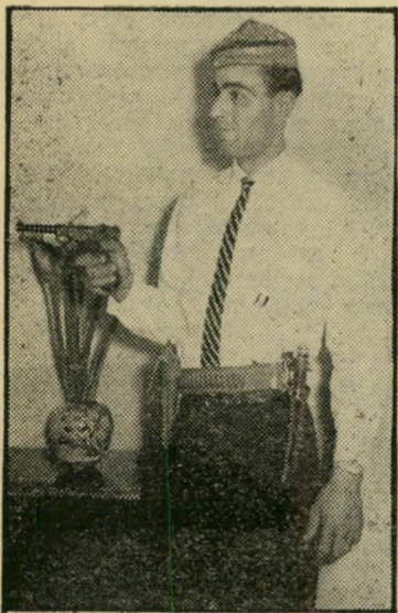
קצב מגזומוף (בפורים) השוחט לא שחט

משפט יצחק בריאור היה משפט בוק. ביום הראשון בו נפתחו בתי-המשפט, אחרי