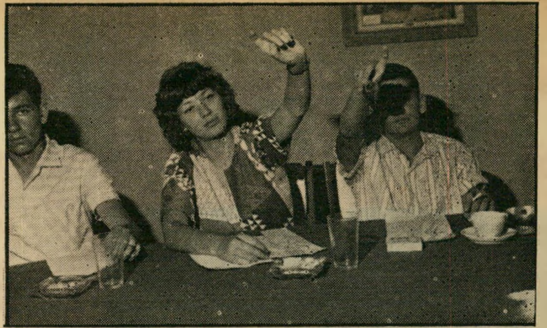
חברייפורום שנמה, דנה וזורם ... ילדה טובה היא זו שאינה רוצה...

החל מגיל 17. מדברים מסתבר שאתם מסכימים להחמרת החוק. שלמה: חוק זה דבר הגיוני זה לא רגש. אבנרי: אתם שוב חוזרים לאותה נקודת דה: זורגש שלכם היינו משלים עם הדין הגיון של עצמכם. מיכאל: אני אין לי פניליאישיות. אני את הבנים שלי ארנך ליושר פנימי. במידה והוא יהיה מתונן פך, הוא יהיה נכון, ויחיה לפי אותו יושר גם בנוגע לי יחסים המיניים. אם אתם אומרים כה מצד אחד לעצמכם בעד יחסימין לפני הנשואין, ומצד שני אתם חושבים שאת הבנים שלכם אתם לא תחנכו כך, אז אתם בעצם לא אצרתם את האמת בנוגע ליושר המיני. או אתם חלק מהחברה שיצרה את המושג הולכים קבוע רק בשביל המגע המיני. ואז זה לא נכון. אצלי בבית אבי אף פעם לא לקח אותי ואמר לי: "אתה שומע, מיכאל, בניגע לחינוך המיני..." אלא הוא חינוך אותי באופן כללי, והחלק מהחינוך הזה יצר את המושגים שלי גם בנוגע למיני, וגם בנוגע לאלפי דברים אחרים. ואני מתאר לעצמי — אומנם לא שוחחתי אתה, אבל נודע לי בבית על זה — ש' הוא לא היה מתנגד לזה אם הוא היה יודע על מה זה מבוסס. על זה שאני לא תופס כל אחת ועושה מה (פולוגי) עושה, אלא שזה באמת בא מתוך רגשות אמיתיים. דני: התפיסה המוסרית הקיימת כיום אינה אומרת ש'בחורה טובה היא זאת ש' אינה מקיימת יחסים עם בחורים", אלא "בחורה טובה היא זו שאינה רוצה בכלל לקיים יחסים עם בחורים". השאלה היא, לכן, מה אתם חושבים צריך להיות? האם גם אתם תחנכו כך את בניכם?