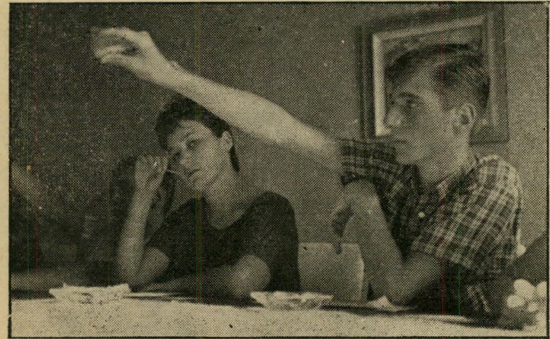
חברי-פורום אכרם ושלומונית

אבנרי: אתם יודעים שהחוק החדש בארץ אוסר יחסי-בין בגיל שש-עשרה. עד עכשיו היה מותר החל מגיל שש-עשרה ועכשיו, לפי החוק החדש, זה מותר רק