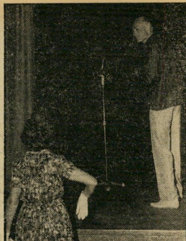
ג'ון גילגוד (שמאל) ומוזכרו (ימין)