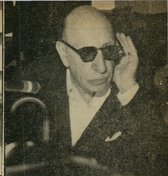
איגור סטראוינסקי בתליאביב ביצת מלחין המזקין?

כוחם להסתיר פיהוקים, ושיחות על ענייני דינמיקה השתלבו בטקסט היחני.