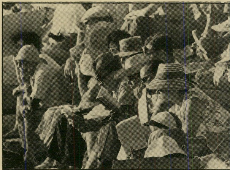
קהל הצופים באמפיתיאטרון בקיסריה* איך תתפשטות יוניות?

"אילו היה תיאטרון ישראלי מציג את המחזה בצורה זו, לא רק שאיש לא היה קונה כרטיס, אלא שהעתונות היתה מקי-מה צעקות על השערוריה." דברים אלה, שנאמרו על-ידי אישיות תיאטרון ישראלית ידועה, כותנו למחזהו הקלאסי של סופוקל-לס, אלקטרה, שהוצג השבוע על-ידי התיא-