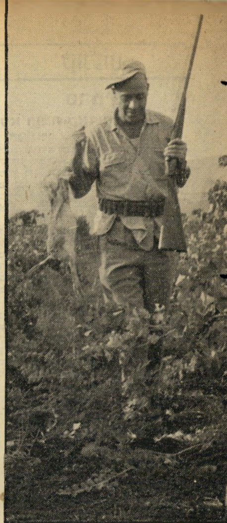
צייד רז וארנבת זה הוגן לחיה?

אחרי סיכסוכים וביורורים בפני מרכז הקואופרציה, הוסכם שאייזנמן יקבל עבר (המשך בעמוד 22)