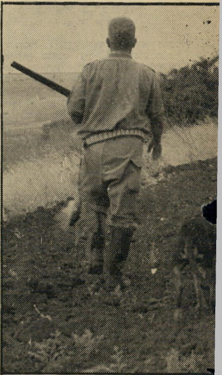
צייד זועבי ומלכה זה הוגן לצייד?

עתה היו הרובים פעילים הרבה יותר. לרגעים אפשר היה לחשוב כי התפתחה