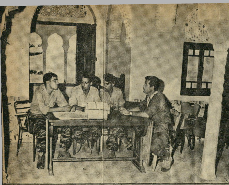
פיקוד וילאיה 4 במטהו "בוז" + "זוז" = "זוז" = "זוז"

המושחתות ביותר עלי אדמות. המיסטר שלה רקוב עד היסוד. בראשה עומד רודן עריץ, השולט בה שלטון ללא מצרים, המחטל ביד חזקה כל אופוזיציה, והנוהג בה כבעל-עסק בחנותו הפרטית. השוחד שולט בכל, ובעלי המיסטר הם בעלי ה"מדינה".