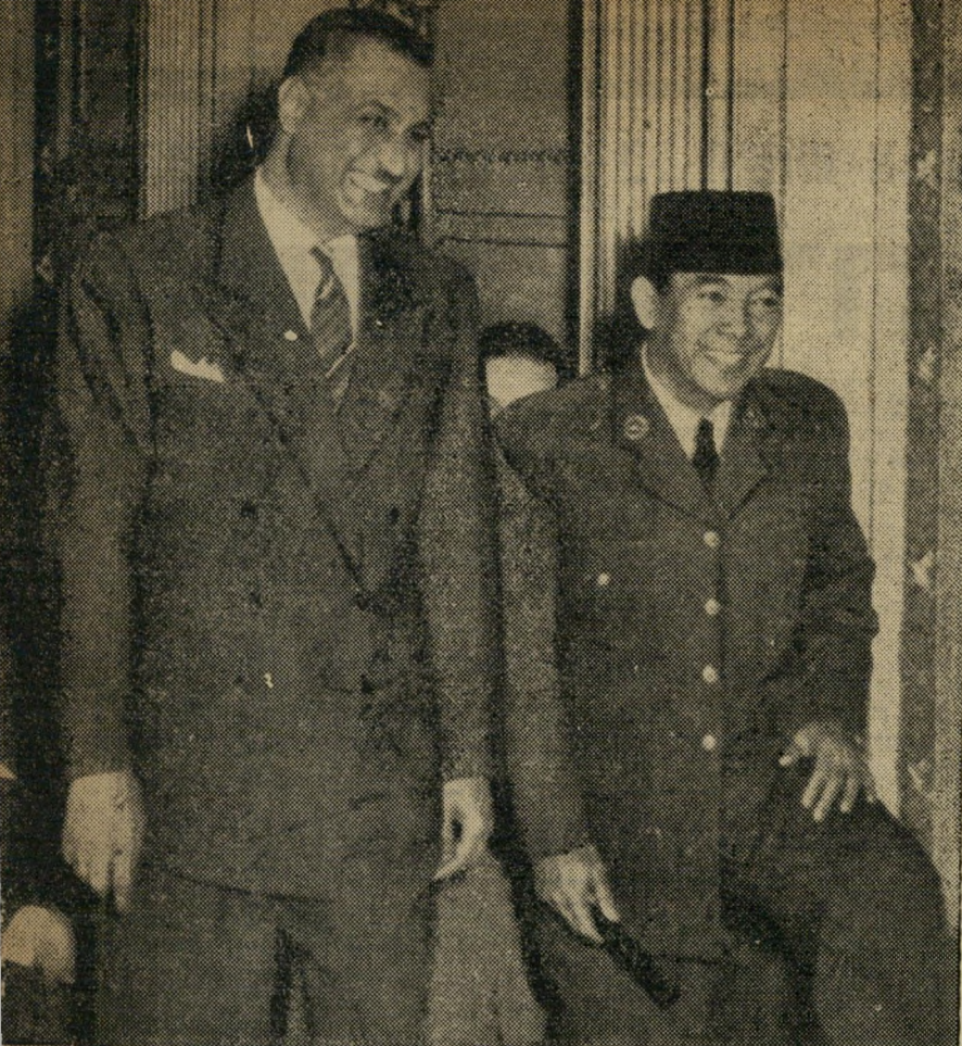
האח הגדול שהשפעתו היא שקבעה בעיקר את שלילת כניסתם של ספורטאי ישראל לג'אקרטה, הוא נשיא מצריים גמאל עבד אל-נאצר, הנר' אה בתמונה זו בחברת ידו ושותפו הפוליטי, נשיאה של אינדונזיה אהמד סוקארנו.

כדי להבין את הרקע המדיני להתפתחות חרפת ג'אקרטה, יש לזכור כמה צובדות יסוד: אינדונזיה, שנשיאה אהמד סוקארנו