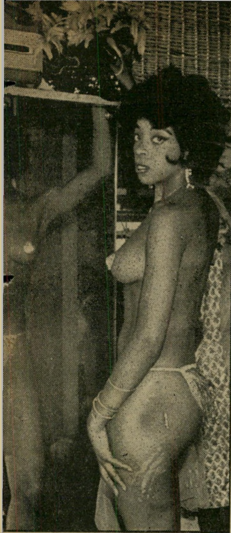
שוגר קנדי בחזרה להלבשה השערות לא הלבנו

ת' נערות סטריפטיו, תוצרת-חוק, הסעירו והעסיקו בשלושת השבועות האחרונים את הארץ. הן עלו לכותרות ה' עיתונים, תמונותיהן התנוססו על דפי רוב השבועונים, הן סייצו למשטרת תל-אביב לבצע מיבצעי-פירסומת מרעיש, העסיקו לב' סוף אף את שופטי ישראל. אולם הן עשו דבר נוסף. הן עוררו מי תרומתם את חילי הלילה של תל-אביב, את אנשי הבוהמה ואת הדון-גיאונים החתיקים והמפורסמים ביותר של העיר הגדולה בי יותר בישראל.