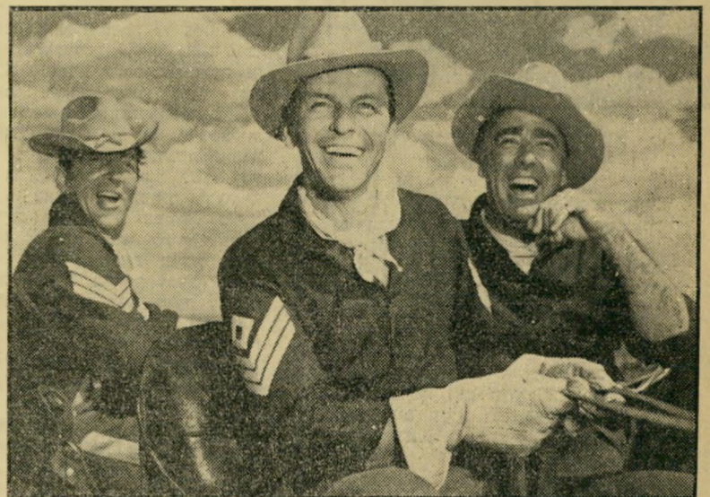
"שלושה סרג'נטים" לאופורד, סינטרה ומרטין משחק פרטי בלבד

מגרעתו הגדולה של הסרט היא התסריט הלקי, חסר המקוריות וההומור, אף ש אינו חסר שטויות למכביר. צילמי הגוף