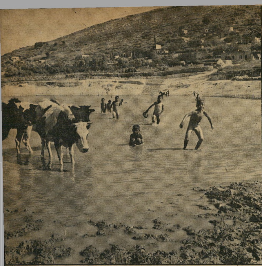
אתמול כפי שאפשר עדיין לראותו בכפר סכנין. זוהי בריכת-מאגר למי-הגשם מים, המקילה על המחזור החמור במים. גם בחודשי הקיץ נשארים מים בבריכה, להשקאת הבהמות ולהנאתם של אזטוטי הכפר. המאגר מתמלא עם בוא הגשם.

את שמו בסוד. מפחד המושל הצבאי, הסביר: "אנחנו לא יודעים מה יהיה סוף המצב שלנו. אבל אולי יבוא יום לעריכת חשבונות. כך — אולי לתיקון גבולות. אנחנו לא רוצים שבאותו יום תוכל מדינת ישראל להציג קושאנים ולומר: 'אדמת התעלה היא אדמת שלי, כחוק. בעליה הערביים מכרו לי אותה תמורת כסף'. ר"י צים להעביר מים לנגב? בבקשה, גם הנגב הוא חלק מהארץ. אבל אנחנו לא ניתן למדינת ישראל תעודת-בעלות עליה!"