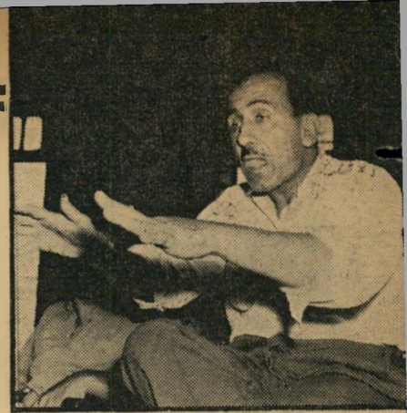
"חס וחלילה!" הודע מנ"ח של תופיק חוסיין, כשנשאל אם אין מאחר" רי התנגדות התושבים נימוק של לאומיות.

עראבה מתוך בהרבה מסכנין. תושבי ערא" בה, אשר ברשותם כ-10 אלפים דונם ב" עמק, נדרשו לסלק את ידם מ-600 דונם הדרושים לצרכי המוביל הארצי. בעלי 200 דונם מתוך ה-600 עשו זאת מרצונם, מכ" רו את האדמה כדת וכדין, במחיר 350 ל"י לדונם, ותשלום מיוחד של 100 ל"י לדונם עבור היבול שיושחת על-ידי הרחפורים.