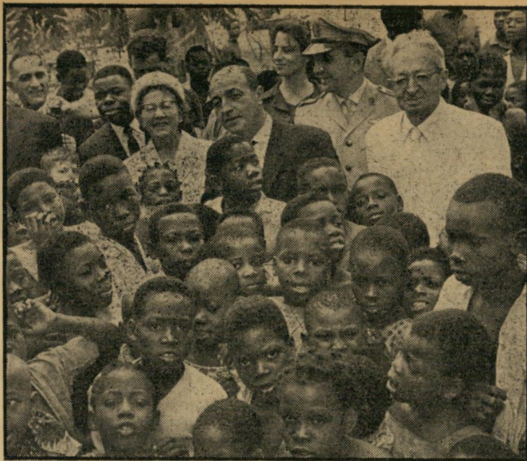
נשיא המדינה בלאופולדווייל (קונגו) איש מפא"י יהיה טועמד

מגדל זה 14 שנים — מאז תפקיד צחוק הגורל דחאק בידי דויד בן-גוריון את קיום צמחתו של זאב זיבוטינסקי — מסרב (המשטח בעמוד 14)