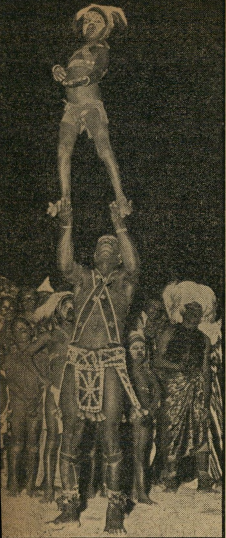
הצגה לכבודו במנורוביה (ליבריה) ליברל יהיה אלטרנטיבה

רבה חדשה להתחיל בפניה נידחת מאד: בבתי הקפה של הכפרים הערביים. ברבים מהם הוצבו, בשנה האחרונה, מכשירי הטלביזיה. מכשירים כאלה משמשים כליבידור בבתי עירוניים רבים, ולאחרונה גם החלו חודרים לחדרי-האכיל של הקיבוצים. אולם בבתי ערביים הם ממלאים תפקיד נוסף: לקרב את הצופים למתרחש בעולם הערבי. על כן החלו אנשי המימשל הצבאי יושבי בים על המדוכה — איך לנפץ את מסך הטלביזיה?