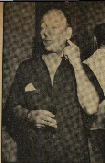
פר ג'ון גילגוד מול הצלמים ומול ההיסטוריה חמש דקות למען הנצח