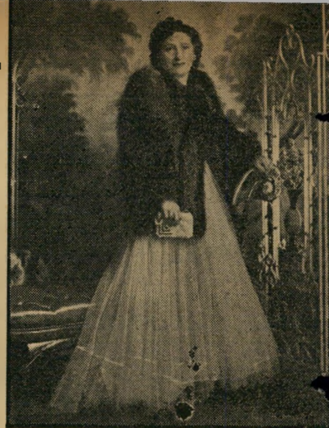
האשה שתמונתה נשלחה עליידי ב' עליה, תוך ציון שהיה רוצה מאוד להופיע כניצב (סטטיסט) בסרט לצידה.

לא שונה הרבה ממנה היא דוגמנית-מוכרת בת 22, מרמת הטייסים: "יש לי נטייה למשחק דרמטי. הופעתי בדוקומנטריים. אמנם לא היה לי ניסיון בדראמטי, אך אני בטוחה שאוכל להתנסות בשטח זה."