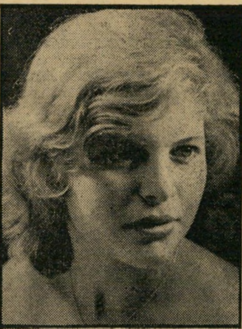
הרקדנית כבר הספיקה ללמוד שלוש שנים בסטודיו של אלישבע מונה. נסיון: בית הספר.