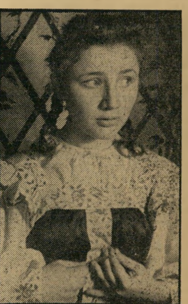
השחקנית למדה בפקולטה ל' תיאטרון וקוננוע ב' בוקארט, שואפת ליותר מתפקיד של ניצב.

רומניה, בכלל תרמה לסוכנות האמנים הישראלית את מרבית הכוחות האינטלקטואליים. הכשרונות הופיעו אצל כל אחת בזוג. כך הן הגדירו עצמן: משוררת-שחקנית, שחקנית-סופרת, במאית-שחקנית, זמרת-ס' ריטאית, סטאטיסטית בתיאטרון הראשי עתונאית, רקדנית-ציירת. עכשיו יכולים כולם להוסיף תואר-כפול נוסף: שחקן-מאוכזב. כי סוכנות האמנים הישראלית, לצערה, אינה יכולה להציע להם שום תפקיד. היא לא אשמה. פשוט אין תעשיית סרטים.