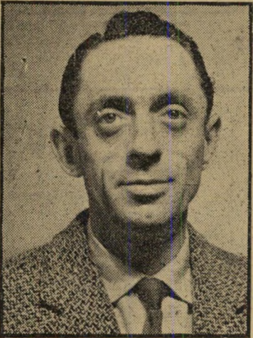
העליז כפי שהוא מכנה את עצמו, הינו עובד יהלומים בן 42. מבין במוטיקה ובזימרה, היה שחקן ברומניה.