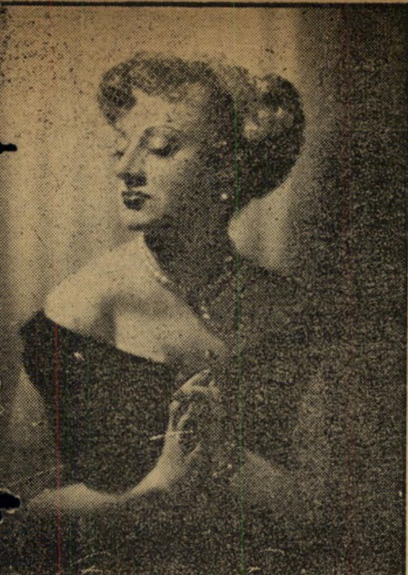
הזמרת אינה סתם זמרת, אלא גם רוקדת, לדבריה. בת ה-28 צירפה גם תמונת-פזוזה חוצלארצית.

נקבעו להם ראיונות. הם מילאו שאלו' נימ, שלחו שמוש תמונות כל אחד — פרופיל וכל הגוף — וחתמו על הצהרה