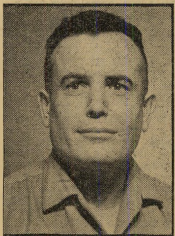
השכנאי לאלקטרוניקה, פתח-תור' אי, יודע אנגלית, ספר' דית ויוונית. כשרונותיו: זימרה ומוטיקה.

ב' חורף עוד הסתובבו כמה מטרי' רפים ברחוב דינגוף, שהאמינו באוטו' פיה של הסרט הישראלי. באיפק הבטיחו חגיגות את ניני, חבורה שזאת, אף מלה למורגנשטיין. ועוד דיברו ברצינות על הסר' טת חמישה סרטים נוספים בקיץ. הסרטת המינהרה ושני שבויים היתה עובדה קיי' מת. ובכלל, הבדיחה הטובה "תעשיית ה' סרט הישראלי", כמעט חדלה להצחיק. ב' תור הזהב הקצר הזה החליטו שני אנשים להקים, את מה שהם קראו, הסוכנות ה' ישראלית לאמנים.