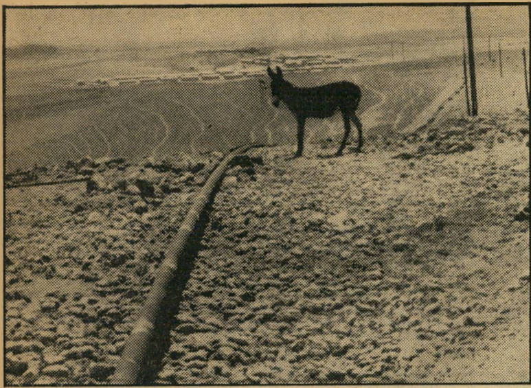
ערך — כיום

נסיעה באוטובוס לאקייס, ברחובות בלתי נראים