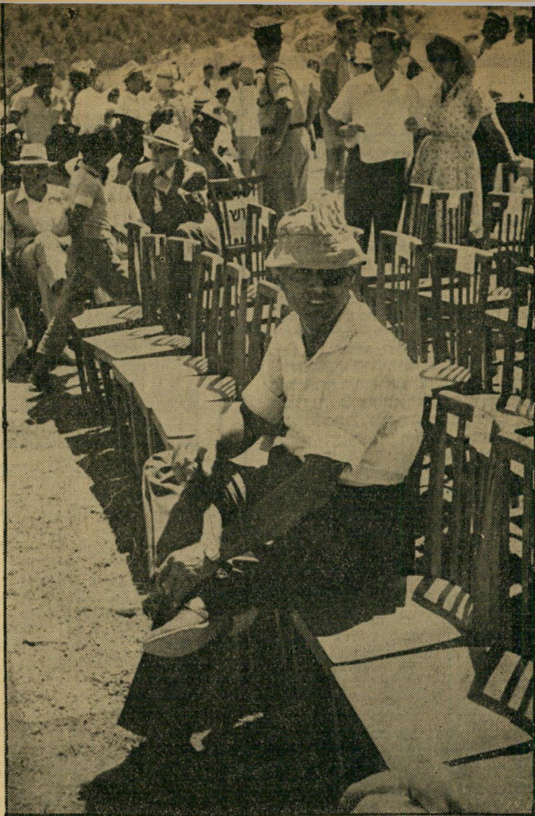
משה דיין בטקס נטיעת יער הופואה-בואני

המשרד הראשי: רח' פרופ' שור 7, טל. 42193 ת"א.