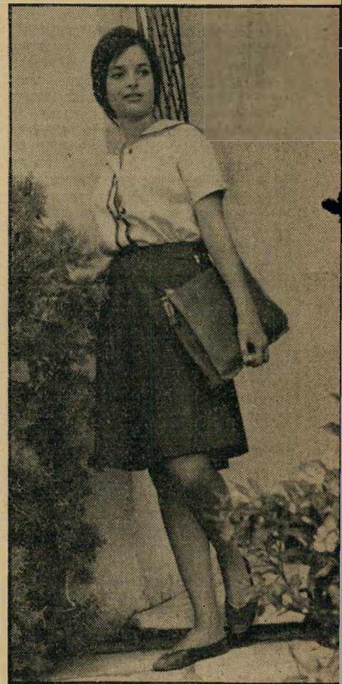
בדרך לגימנסיה אימת המורים

אולי מפני שההררכה נתנה לי שליטה בבני אדם. אבל לא השתלכתי בחברה. זאת לא הפעם הראשונה. גם בבית-הספר העממי הייתי מאוד לא אהודה. ישבתי בצד, לא הופעתי לפגישות כתה, בחלקו מפני שזה לא התאפשר לי מבחינת הבית. הייתי נתונה למצבי רוח. לא היו לי חברות בבית-הספר. באופן יוצא מן הכלל היתה חברה אחת. היא היתה עילוי. אחרי זמן קצר הסתכסכנו על הרקע מי יגיד ומי יקבע.