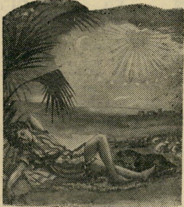
"ויהלום יוסף הלום"

לאחר ההצלחה בארה"ב ובארץ וברשות ההוצאה "סאן", ניו-יורק "ספורי התנד" בחמונות"