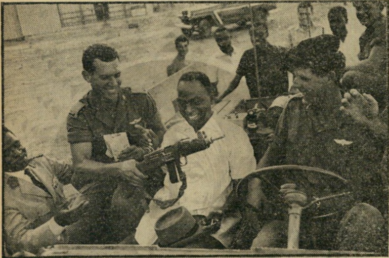
הופאה בואני ממרכ לקחת את ה"עזוי" - קשרים הדוקים