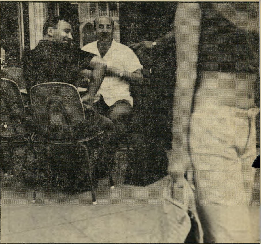
לסובת הרעיון הביעה חבורת פקידים ליד קפה לפניהם לא ריגש אותם כלל.