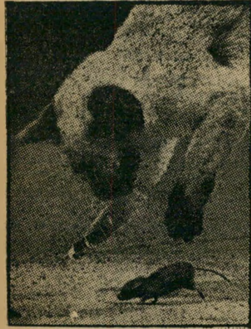
ברמיאו בימי זוהרו

אולם לא פחות זועזעתי מפיסקה אחרת באותה הכתבה, המוענת שמאחורי הרדפה האנושית בבית המריבה מסתתרת, מתיחות ביזערית השוררת בישראל. ... כתייל בצה"ל, המשרת ביחידה שבה משרתים ישראלים יוצאי מרוקו, תימן, רוי סניה, עיראק, פולין וכו', ברצוני להודיע כי שום מתיחות ערתית אינה שוררת בינינו, אלא ההפך הוא הנכון. אולם לא רק בצבא, גם בחיים האזרחיים, שבהם כל אדם בוחר לו את ידידיו, ניפני