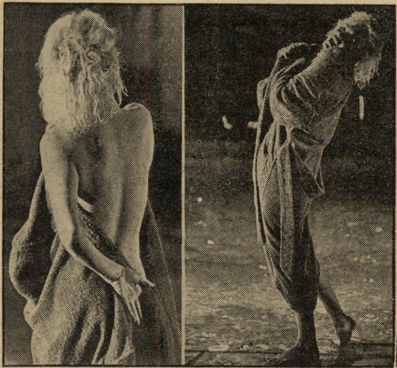
מארילין עולה מן הבריכה מה חטר בניל 240