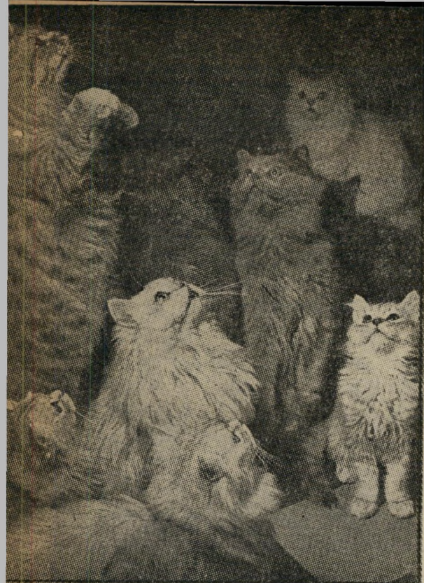
מטס השבעה של צ"ח