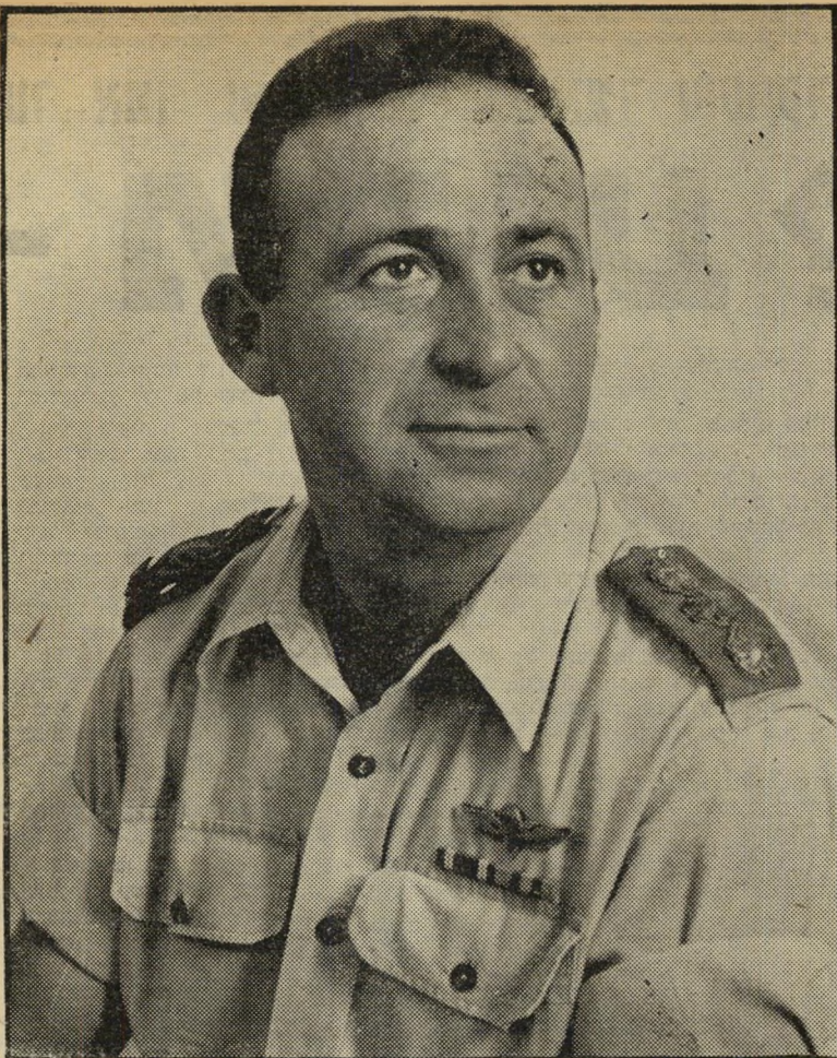
אלוף זורע מן קוצר?

החוג של צעירי ביגוי הוא סגור ומסוגר, אליו הצליחו לחדור נערי־החצר רק לאחר מאמצים ממושכים. על כך, ברגע שמופיע על הבמה מועמד חדש לחוג זה, רואים