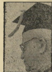
דר' בני ימין

לאחר שבגוררין כבר, יש להצטרף להכתיר את דר' בני ימין זאב הרצל ב' תואר איצטננין - סורסוף היה הוא תיזה המדינה ויש לו גם זקן פתאים. תל-אביב