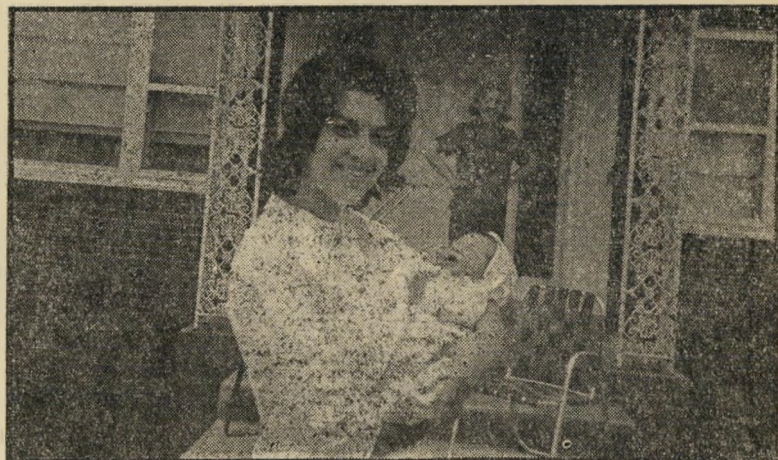
הקוראה בראון, בתה ואמה

אנו עוקבים בנשימה עצורה אחר מלה מת מחתרת העכברים בנזע החתולים. אנו