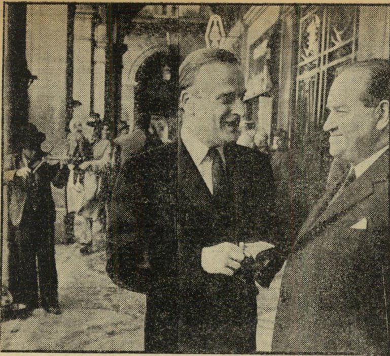
אויסטרך, מנוחין וקבצן הכינור השלישי זוכה