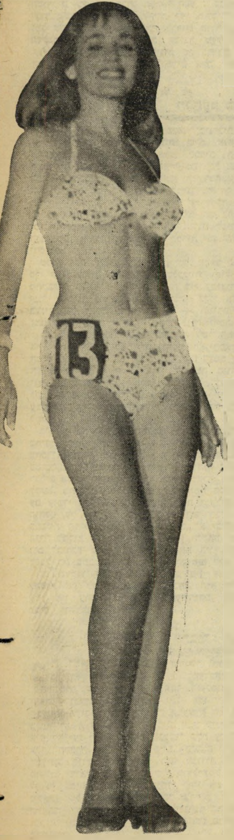
בת 14 וחצי

ה הפתעויות הראשונה של הקהל על עשרה המועמדות האחרות בתחרות סיוספית זו לה ללא התראה מוקדמת, לצלילי תזמורת רומאן מ"את מפוטרת" הודיע ברורות למועמדות שצעה ס רורית בעיניים עצומות. "גם שנתנו לך לעלות", התריס צופה אחד בפני