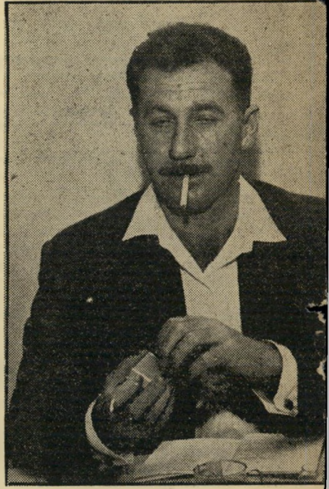
חדר-הגרדום בכלא רמלה. השניים, שנבחרו לייצג את פניו בפני חבריהם למקצוע, בפגישה דחופה בשעה זעמוקה מן המחזה שזה רק עתה חזו בו במו עיניהם.

נפילה של מטר או מטרו-חצי — והחבל התמתח. בשניה זו נשברה מפרקתו של ה- איש שאירגן את השמדתם של מיליונים