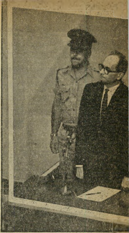
ביתא הזכוכית: הרגע האחרון עד הסוף המר