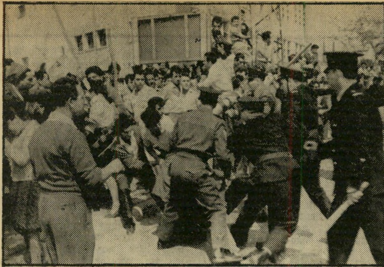
תמונת סוכנות הידיעות הסינית — מה זה —